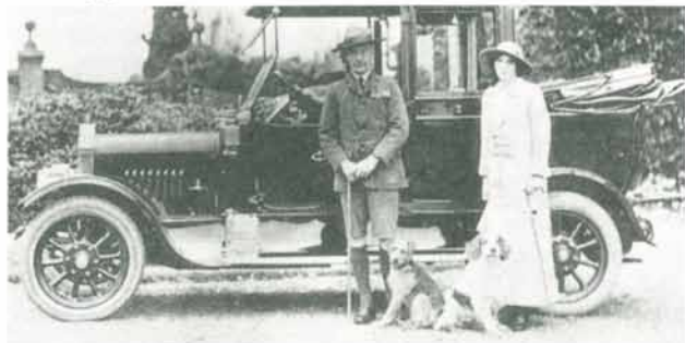
Robert Baden-Powell (22. februar 1857 - 8. januar 1941) og Olave St. Clair Soames (22. februar 1889 - 25. juni 1977) blev gift i oktober 1912. 100 000 spejdere gav hver 1 penny til bryllupsgaven, en bil.